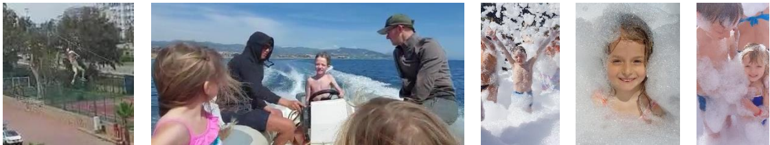
На тарзанке, катере и в выдуваемой из трубы пене в Турции.

В Турции наши немецкие внуки вовсю резвятся на немыслимых аттракционах типа полётов на тарзанке и на парашютах, катания на катере, а также барахтания в пене, не говоря уже многочисленных купаниях и спусках в воду по трубам.