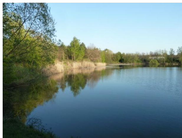
Озёра под горой.