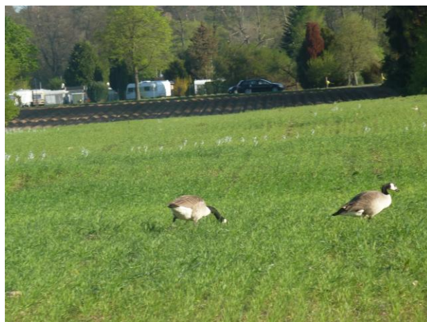
Дорога к горе Обервальдберг (слева). Гуси справа от дороги.