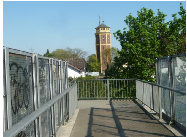
Северная окраина Мёрфельдена и переход через железную дорогу.