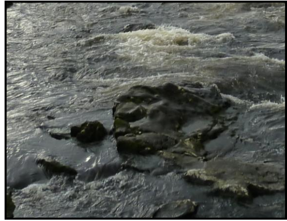
В устье Колы, 1 октября 2011 г.