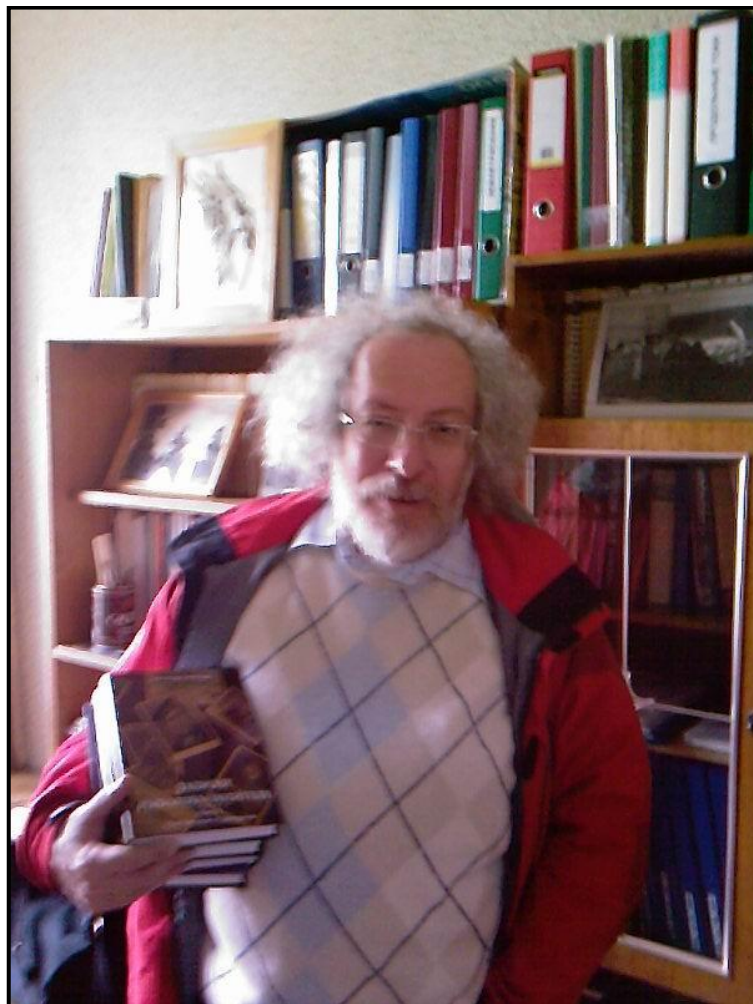
Алексей Алексеевич Венедиктов, 13 мая 2011 г.

Отправился туда и с удовольствием Венедиктова послушал. И студенты меня порадовали, толковые вопросы задавали, я даже удивился, откуда такие взялись. А после окончания встречи я затащил Венедиктова к себе в кабинет (как главный редактор главного редактора) и подарил ему два комплекта двух первых томов «Записок» - для него и для Юлии Латыниной, которые он с явным удовольствием принял, не взирая на их увесистость. И сфотографировал его мобильником с моими книжками в моём кабинете.