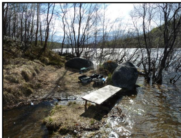
Новое место рыбалки, 25 мая 2011 г.