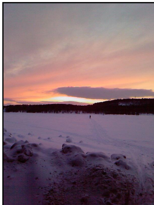
На лыжне у Большого Питьевого озера, 5 февраля 2010 г.