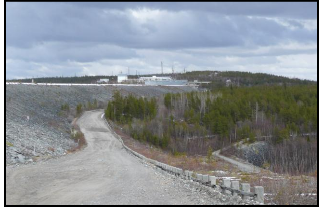
На льду Верхне-Тулумского водохранилища. Плотина Верхне-Тулумской ГЭС. 18 мая 2008 г.