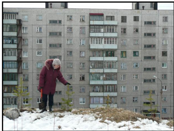
Посадка сосенок 18 мая 2008 г.

А вчера я опять собрался туда же. Машина во дворе примёрзла передними колёсами к снегу, и я никак не мог сдёрнуть её с места. И чего-то мне взбрело в голову, что дело не в снеге, а в ручнике, на который я поставил машину, и с которого машина теперь не снимается. Я потратил пару часов на то, чтобы снять сиденье и кожух ручника, убедиться в отсутствии видимых неисправностей, сходить в автомагазин, там проконсультироваться, вернуться к машине и сдёрнуть её таки со снега, к которому она в самом деле примёрзла, а ручник был в полном порядке.