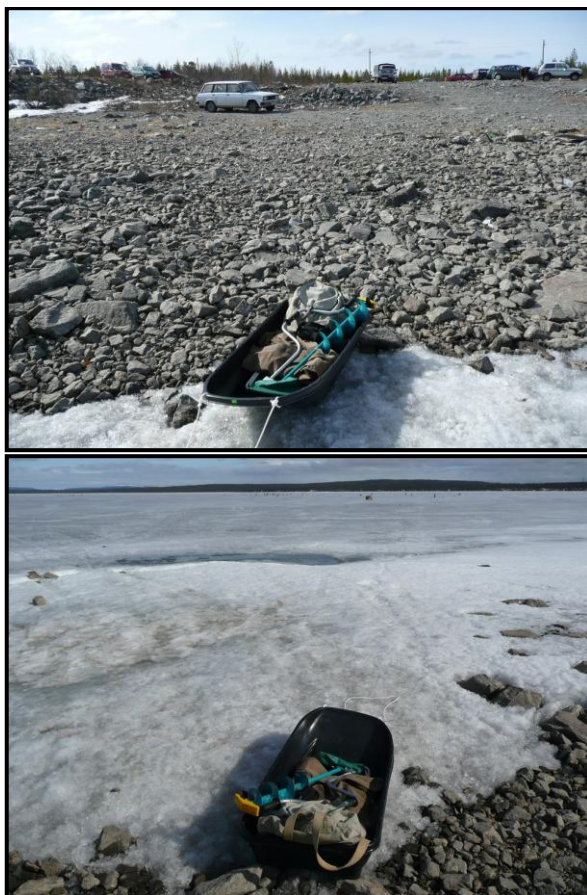
Моё свежескупленное корыто-волокуша перед выходом на лёд Верхне-Туломского водохранилища, 11 мая 2008 г.