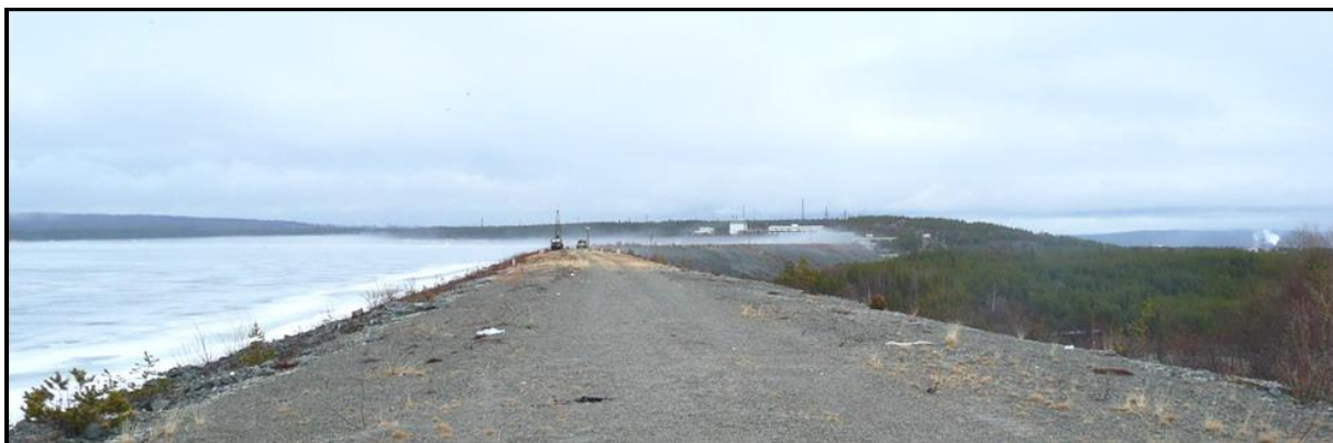
Дамба Верхне-Тулумской ГЭС. Слева – водохранилище, справа внизу – Тулома.