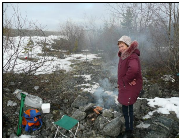
Справа от дамбы, 9 мая 2008 г.