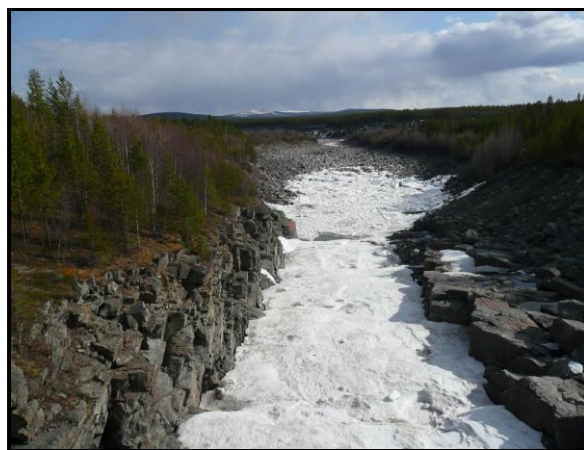
Плотина и водосток Верхне-Тулумской ГЭС, 10 мая 2008 г.