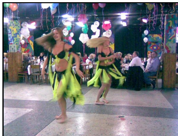
Праздничный вечер 7 марта в МГТУ.