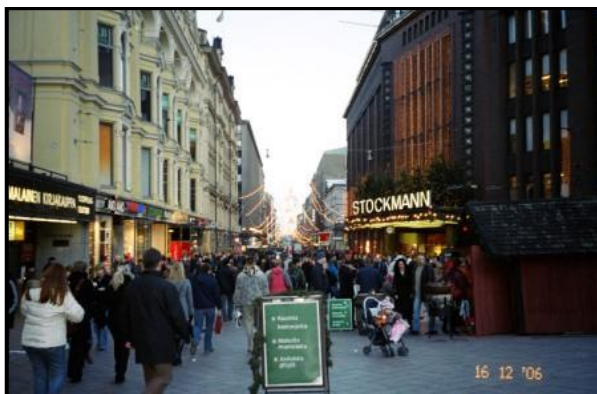
Район вокзала. Хельсинки, 16 декабря 2006 г.

Дискуссии же на симпозиуме шли, в основном, между российскими участниками, преимущественно в форме сетований на Фурсенко (министр Обрнауки) и Думу, не выделяющую достаточно средств на науку и образование. Месяц говорил о старении и вымирании кадров в Академии, об отсутствии притока молодёжи. Всё, впрочем, известные вещи.