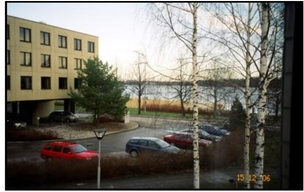
А здесь проживали на берегу Финского залива.