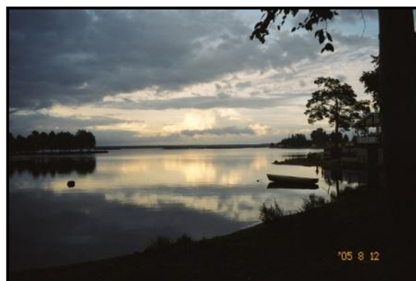
Озеро Разлив вблизи тёти Тамариной дачи.