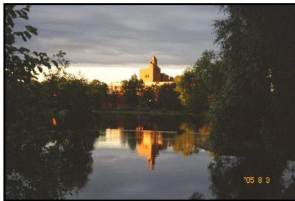
Водосливный канал и озеро Разлив в Сестрорецке. 3 августа 2005 г.