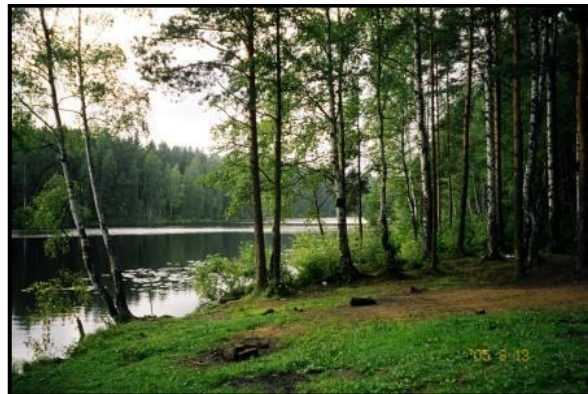
В окрестностях Всеволожска. 13 августа 2005 г.

Прибыли в Мурманск, а тут холод (10 градусов) и дождь. Даже в лес по такой сырости не тянет.