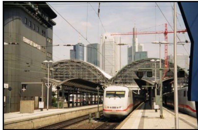
Главный Вокзал Франкфурта на Майне. 30 апреля 2005 г.