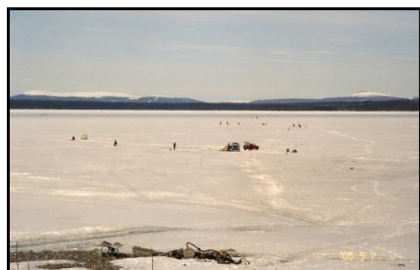
На Верхне-Тулломском водохранилище. 7 мая 2005 г.