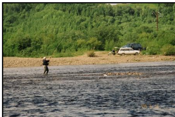
Нахлыстовики в Шонгуе. 26 июня 2005 г.