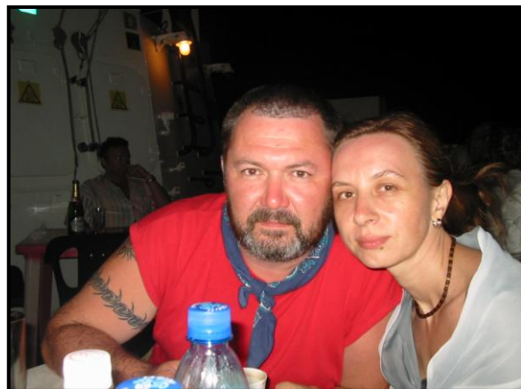
Танюшка и я.