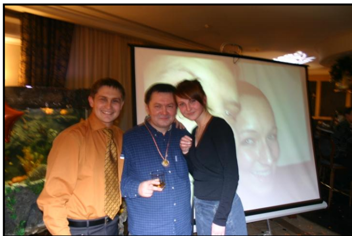
А эти снимки сделаны 26 ноября. Мы празднуем 6-летие нашей компании.