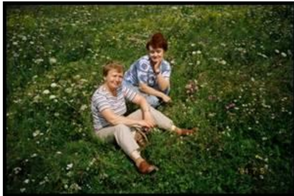
На лугу у Нерли. 8 июля 2004 г.