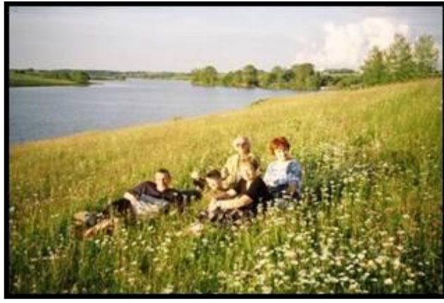
На берегу Содышки. 7 июля 2004 г.