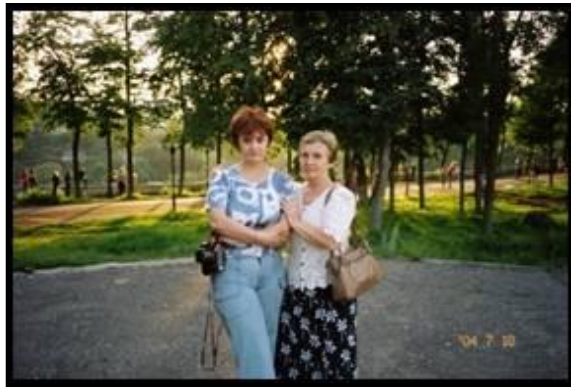
Над Клязьмой. 10 июля 2004 г.