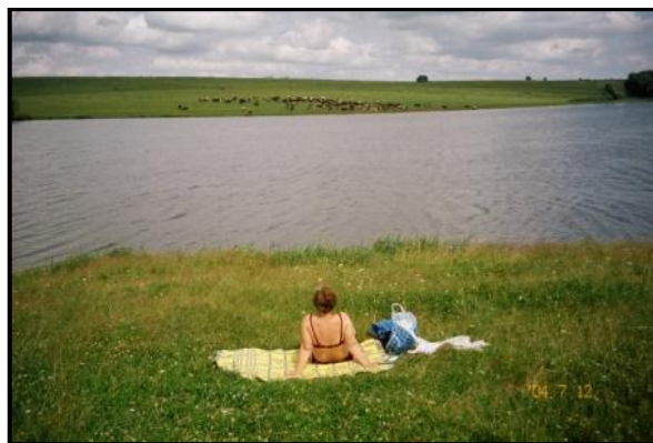
На Содышке. 12 июля 2004 г.