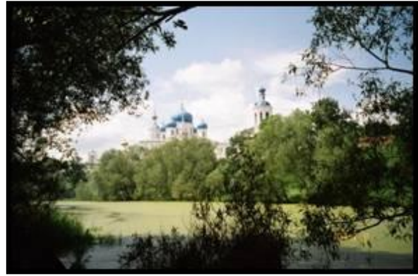
Боголюбово. 8 июля 2004 г.