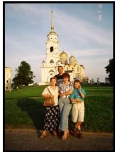
Гуляем по Владимиру. 10 июля 2004 г.