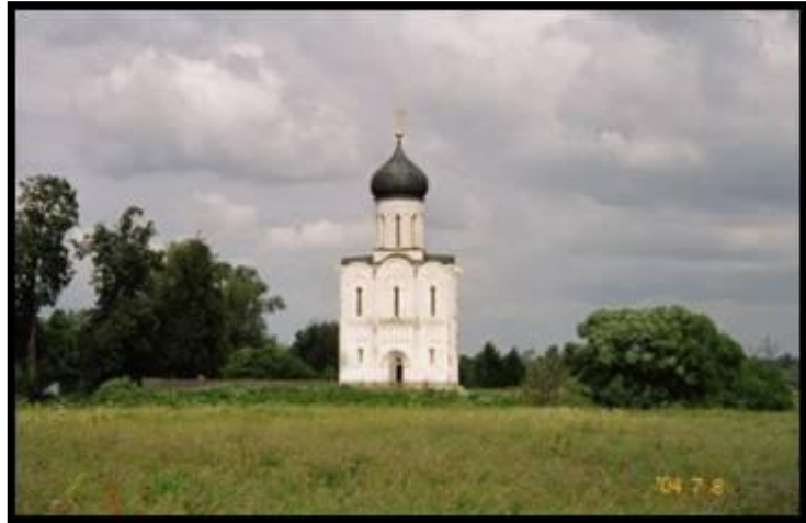
Покров на Нерли. 8 июля 2004 г.