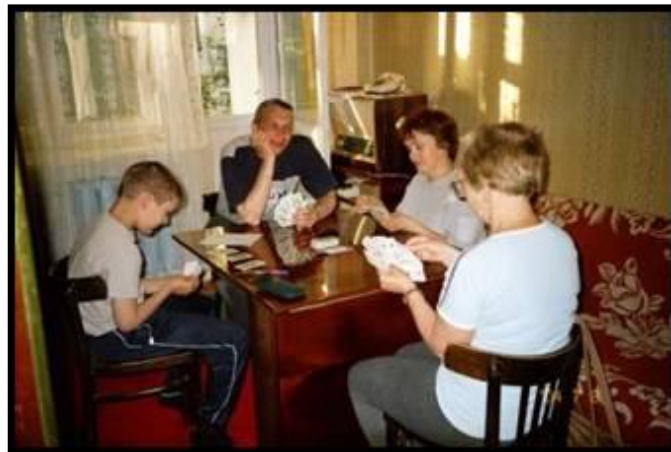
Картёжники. 8 июля 2004 г.