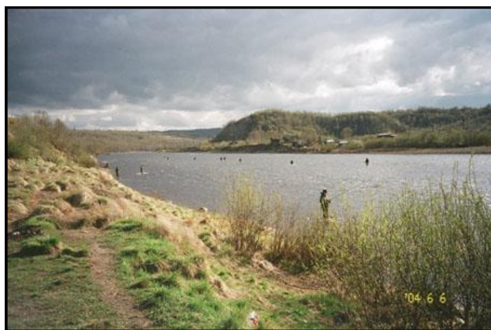
Рыбаки у лицензионного пункта в Шонгуе, 6 июня 2004 г.

Вернувшись на машине к лицензионному пункту чтобы закрыть лицензию, я обнаружил там уже восемь нахлыстовиков в воде у противоположного берега и четверых поплавочников на этом берегу. У дежурной в вагончике я поинтересовался, а сколько всего рыбин выловили? Оказалось, что почти за сутки всего-то только три: на 4.5, 7.5 и 11 кг. Не густо, мягко говоря.