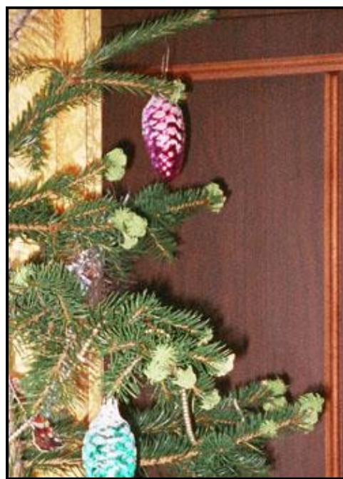
Цветущая ёлка, январь 2004 г.