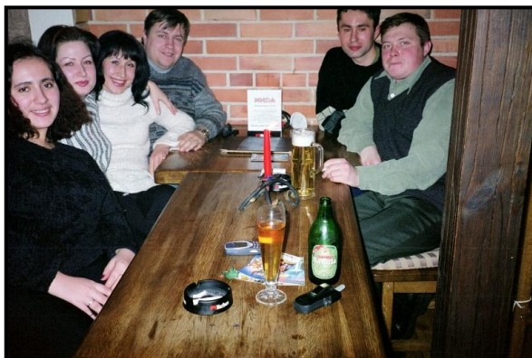
Митины одноклассники с жёнами, март 2003 г.

Сам Калининград произвёл относительно благоприятное впечатление – большая бизнес-активность. На пустыре у остановки воздвигли супермаркет с большими залами и разнообразием товаров больше констанцкого; что удивительно, часто небольшие очереди при работающих десяти кассах, то есть место очень людное. Ленинский и прилегающие улицы также забиты магазинами, много нового строительства, строительно-ремонтный бум ощущается и в народе.