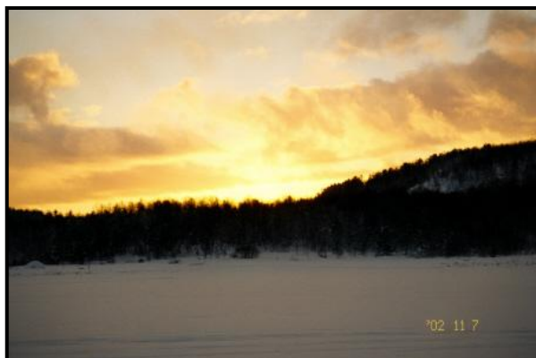
Небеса над Большим Питевым озером у 3-го КП, 7 ноября 2002 г.