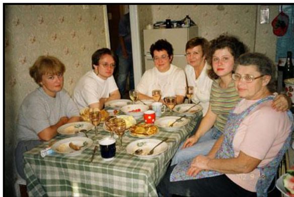
В Тамбове, 13 сентября 2002 г.