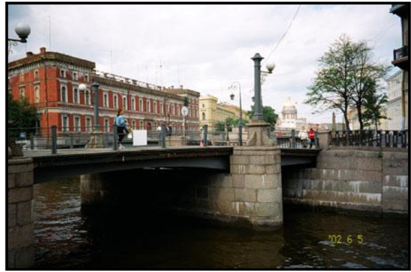
Санкт-Петербург, 5 июня 2002 г. (снимки сделаны по дороге из итальянского консульства)