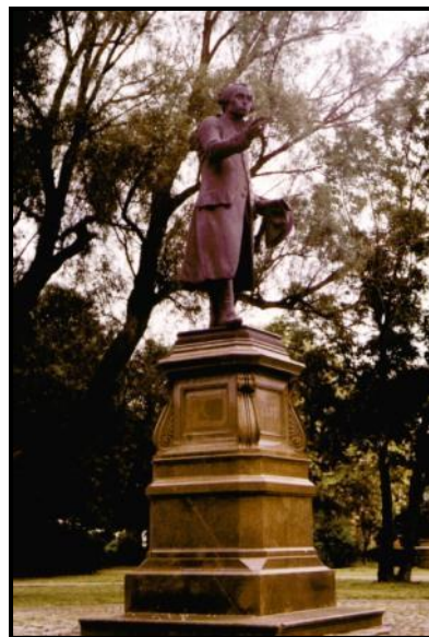
Калининград, май-июнь 2002 г.