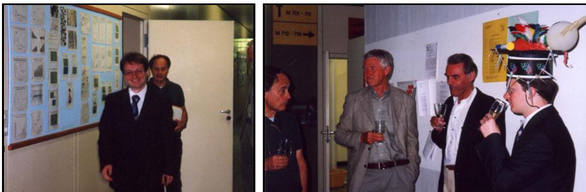
После докторского экзамена, Констанц, 10 июня 2002 г.