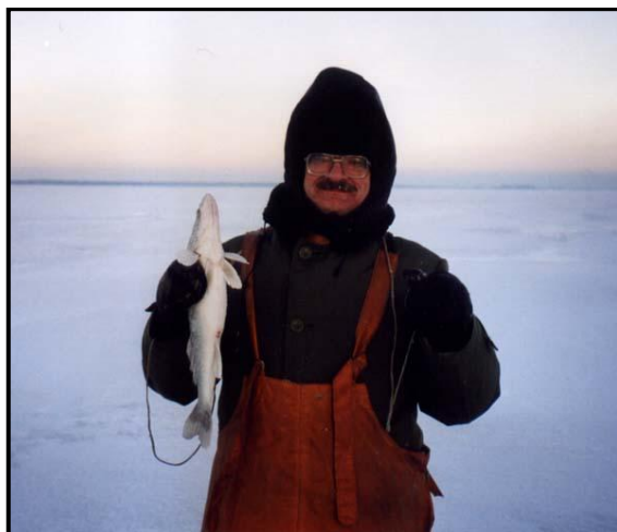
Я с судаком, 3 января 2002 г.