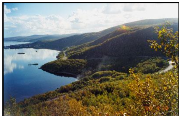
Виды на Мурманск и Кольский залив с соседней с Мишуковой горы, 10 сентября 2000 г.