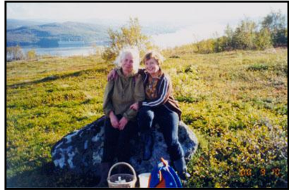
Я собираю бруснику лёжа на соседней с Мишуковой горе, 10 сентября 2000 г.

Спуск же с горы был очень нервным, так как я потащил девушек напрямки к шоссе по очень крутому, почти отвесному склону, но с полдороги от этой затеи пришлось отказаться и лезть обратно наверх, что составило весьма неслабое физическое упражнение. На этом склоне, кстати, мы добрали волнушек до двух третей корзины грибов, среди которых впервые в наших северных лесах мне попался большой выводок лисичек; подосиновиков же нашли всего три и девять подберёзовиков.