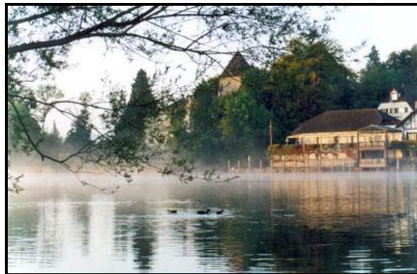
Готтлибен, сентябрь 2000 г.

В субботу снова ездил на рассвете в Вольматинген Рид, был там часа четыре. Часов до восьми утра в стоящем на противоположном берегу Рейна Готтлибене ни души, и цапли гуляли прямо по набережной (а штуки три-четыре обосновались во владениях Готтлибенского замка). Всё хотел застать момент, когда цапля какую-нибудь рыбу поймает, но так и не дождался.