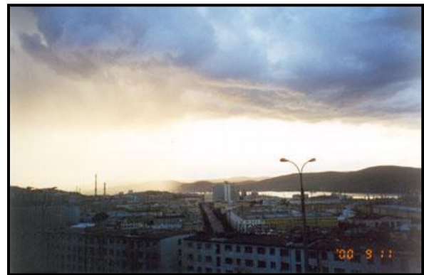
Дорога от гаража к дому (улица Седова), 11 сентября 2000 г.