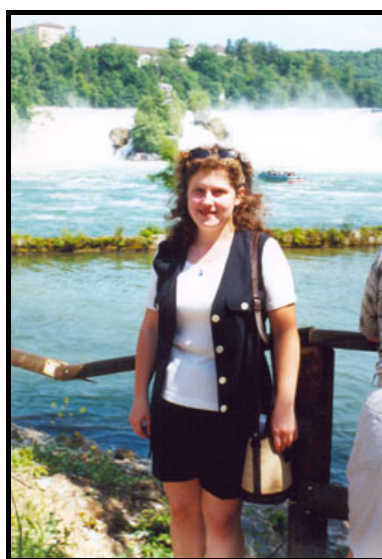
У водопада в Шафхаузене, июнь 2000 г.

На работе всю неделю, включая выходные, подготавливал программы работы на Vertiefungskurs'e. Будем ставить новую для нас (и весьма мало опробованную в целом) методику измерения свободного цинка в живых клетках. Приходится просто утопать в достаточно новой для меня литературе. Всё здесь весьма непросто, очень много различных подводных камней, поэтому адаптация этой методики к конкретной системе может занять немало времени.