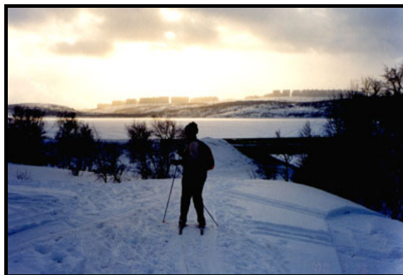
Сашуля на лыжах, 26 марта 2000 г.