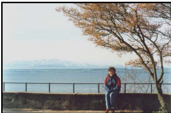
На набережной в Меерсбурге.

Вчера был замечательный солнечный день, и мы ездили на велосипедах (одолжили один у Бернда) по противоположному берегу Бодензее от Меерсбурга до Юберлингена.