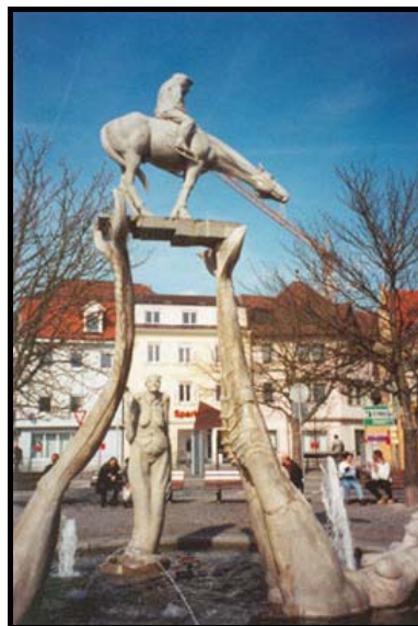
Фонтан «Всадник» Петера Ленка в Юберлингене, март 2000 г.

В Меерсбурге были ещё на блошином рынке, приобрели там набор стаканов за четыре марки и путеводитель по северному берегу Бодензее за шесть марок (обычно это стоит около сорока марок). Вместе с посещением рынка гуляли часов шесть.