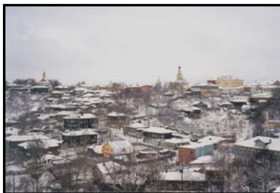
Владимир, январь 1999 г.