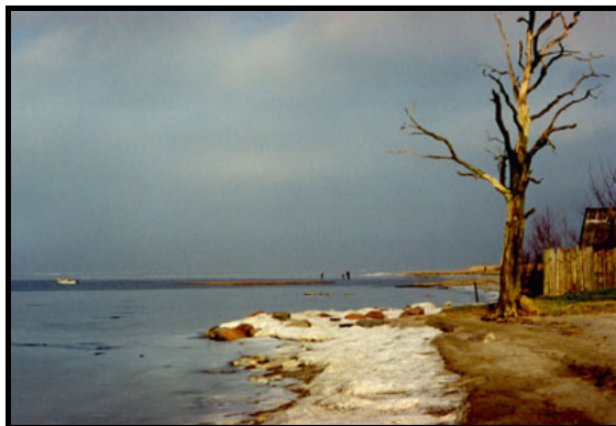
Калининградский залив в Береговом, 8 января 2000 г.

Погода в Калининграде после вашего отъезда так и оставалась слякотной, остатки снега сошли, но я всё же съездил в Ладушкин 8-го посмотреть на залив у Берегового. Лёд есть, но паршивый, и народу на нём не видать, лишь один катер куда-то пёр ледоколом по трещине. Я зафиксировал состояние залива на фотоплёнку и возвратился восвосяи водку пить.