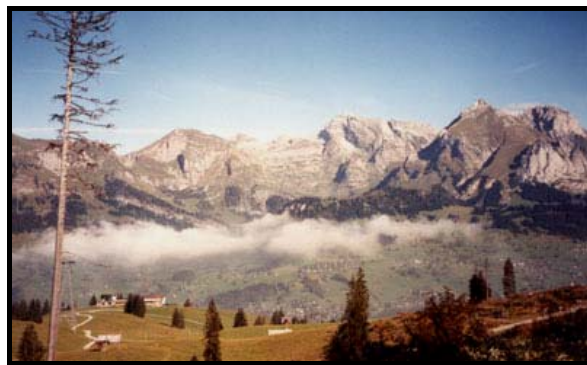
Сантис с Кэзерругга, 12 октября 1999 г.