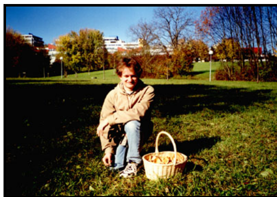
Рыжики в университетском лесу (Майнаувальд), 31 октября 1999 г.