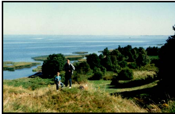
Ваня и Алёша над Калининградским заливом в Ульяновке на спуске от обсерватории, 1999 г. Хорошо видны камыши, в которых я ловил краснопёрк в молодые годы.