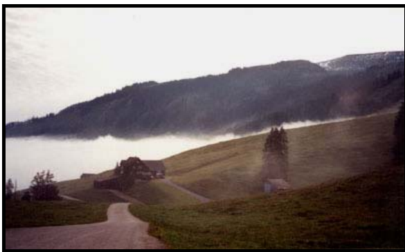
Швенди в тумане.