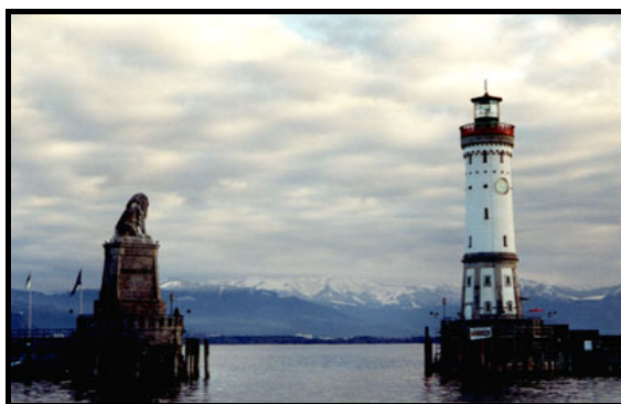
Линдау, 7 ноября 1999 г.