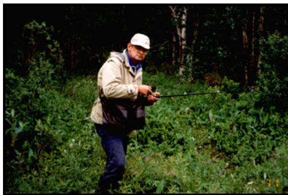
На Лавне, 11 июля 1999 г.