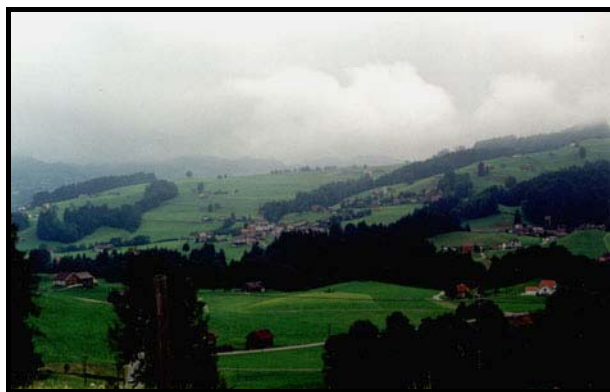
У Аппельцеля (Швейцария), 11 июля 1999 г.

До Аппенцеля - ещё 14 километров, с чередующимися подъёмами и спусками. Дорога весьма красивая, иногда проходит по лесу, один раз пересекает большой каньон, а с обеих сторон горы, покрытые лесом или лугами. Тут и там разбросаны небольшие фермы, хотя плотность построек, конечно, намного меньше, чем в Тургау.