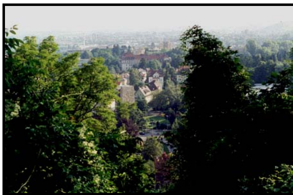
Равенсбург, 4 июля 1999 г.

В сам Равенсбург я приехал около восьми часов. Старый город был окружён стеной, которая, как и башни с воротами, сохранилась в основном и сейчас. В это время там почти никого не было. В старом городе довольно много примечательных зданий, с большой башней Blaserturm в центре, ещё более высокая башня (Mehlsack), однако, находится за городской стеной, у подножия высокого холма. На этот холм (Вайтсбург) я забрался по лестнице, ещё с XII века на вершине были укрепления, а постройки, стоящие сейчас, относятся к прошлому веку. С холма хорошо видны и Равенсбург с Вайнгартеном, и даже Фридрихсхафен.