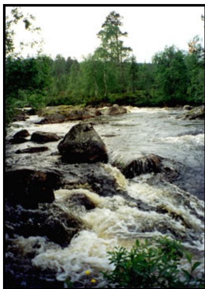
Лавна, 10 июля 1999 г.

Мама, когда сидит рядом, выполняет функции штурмана, напряжённо следит за обстановкой. Изучает ПДД, вчера за билеты взялась. Но за руль ещё не садилась. В субботу мы с ней впервые ездили на базар, что на Володарского, а после обеда - на Лавну. От дома до поворота с шоссе на просёлок к Лавне 33 километра, проехали через весь город через множество светофоров, по трассе мне мама не позволяла разогнаться, велела семьдесят держать. От поворота по грунтовой дороге проехали 6 километров, причём в одном месте пришлось проезжать через "Чёртов мостик" над ручьём - насыпь шириной как раз в машину, огороженная четырьмя жёрдочками. Дорога шла и куда-то дальше, но более колдобистая, и мы оставили машину на лесной стояночке, а сами спустились к Лавне, шум которой доносился из-за деревьев снизу.