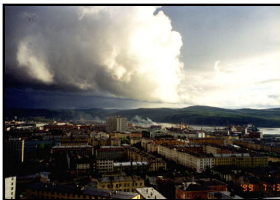
Вид на тучу над Кольским заливом из нашего окна, 13 июля 1999 г.