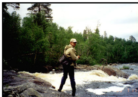
На Лавне, 10 июля 1999 г.