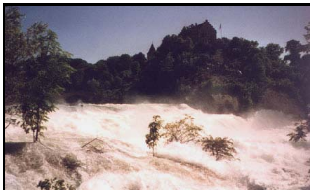
Искупавшись в Рейне, 29 мая 1999 г.