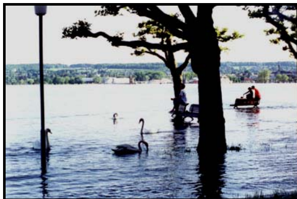
Наводнение в Констанце, 24 мая 1999 г.