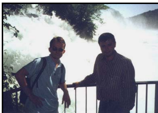
У водопада в Шафхаузене, 29 мая 1999 г.

Место это, конечно, великолепное. Нам к тому же повезло, так как ток воды через водопад был в несколько раз выше обычного (третье значение в истории наблюдений) - 12000 кубометров в секунду (ширина водопада более ста метров, высота двадцать с лишним). Чуть выше водопада через Рейн перекинут железнодорожно-пешеходный мост, идущий к замку, стоящему на скале на противоположном берегу Рейна. Прямо под водопад заплывают лодки (поездка стоит около десяти франков). Посреди водопада поток ударяется в скалу, рассекающую его надвое. У правого берега (по которому едут автобусы) крутится колесо водяной мельницы. Везде оборудовано множество смотровых площадок, некоторые очень близко к потоку, постоянно находящиеся под дождем брызг. Из-за наводнения некоторые площадки затоплены. Гуляли мы почти два часа, любуясь пейзажем и фотографируя.