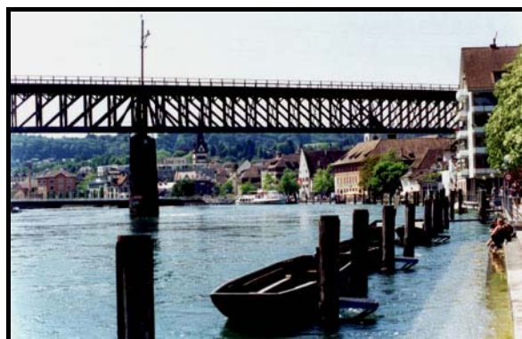
Шафхаузен, 29 мая 1999 г.

Погода, как и все последние дни, стоит замечательная и температура в середине дня почти достигает тридцать градусов. Цвета поэтому вокруг очень яркие, всё в зелени. Уже пока поднимались к замку, прошли через весь центр города, не очень большой (сам Шафхаузен в два раза меньше Констанца).