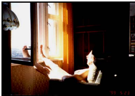
Я загораю в кресле у окна, 23 мая 1999 г.