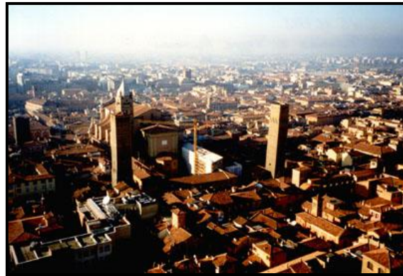
Вид Болоньи с Торре Азинелли, 15 ноября 1998 г.

А после торре мы пошли к монастырю Сан-Лука на юго-западной окраине Болоньи. Стоит он на очень высоком холме и добирались мы дотуда более полутора часов, причём почти полпути под одним портиком (на улице via Saragosa ), и полпути в гору под портиком монастырской стены. Добрались уже когда почти стемнело, поэтому хоть виды оттуда были красивейшие, не уверен, что они хорошо получились на плёнке из-за низкой её чувствительности (200).