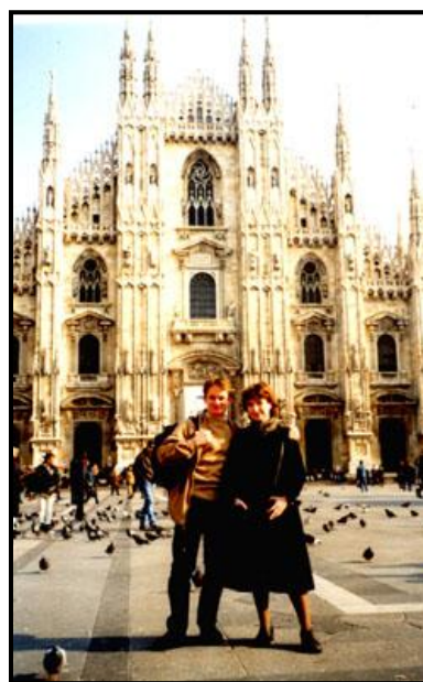
Милан, Дуомо, 13 ноября 1998 г.

Саша же работает в Болонье в химическом институте при Университете (тоже более аналитическая химия, чем энзимология), живёт на частной квартире и тоже не имеет широкого круга общения. На выходные они обычно находятся вместе, ездили, например, во Флоренцию, собираются в Венецию, Рим, может быть, Равенну.