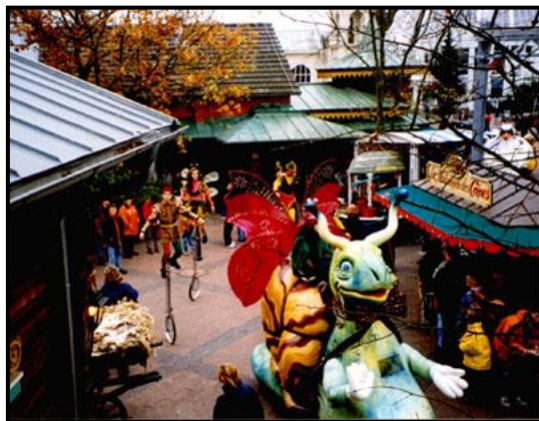
В Европа-парке, 31 октября 1998 г.

Наиболее удобно было бы ехать в Милан через Швейцарию, но для этого нужна Швейцарская виза. Поэтому либо я поеду тем же путём, каким ехал сюда (то есть через Мюнхен), и тогда, может быть, в Рим, а не в Милан, либо полечу из Штутгарта. Возможно, транспортные расходы мне в лаборатории оплатят, хотя полной уверенности в этом нет. Поеду же я либо на этой, либо на следующей неделе; возможно, заеду и в Марио Негри.