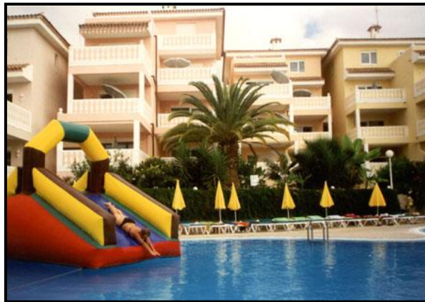
Во дворе Чайофы.

И какие-то фокусники уже с утра выступают перед публикой у фонтана. И супермаркеты (два) недорогие, и всё есть, даже с рыбой получше, чем в Лос Кристианесе, побольше выбор. Пивом и вином мы уже затарились, литр пива и литр красного выпили с фруктами и печеньем, заготовленными в номере для гостей, и я остался писать здесь в лоджии, остальные пошли жариться к бассейну.