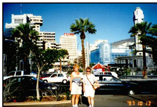
На набережной и площади Испании в Санта Круз.