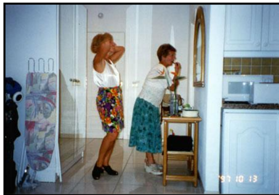
Девушки перед выходом в город из Чайофы.