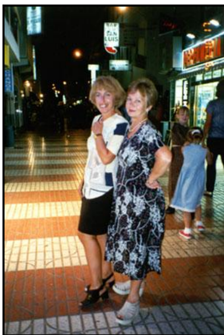
Девушки в Плайя де Лас Америкас вечером (по дороге на концерт).