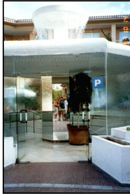
У фонтана с зеркалами в Плайя де Лас Америкас.