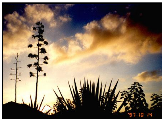
Восход солнца в Чайофе.