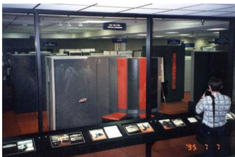
Вот они - суперкомпьютеры!

Бесплатное пиво на постерах - мечта идиота. Артур Ричмонд подошёл, опознал меня по табличке по груди, поговорили. Очень приятное впечатление он на меня произвёл.