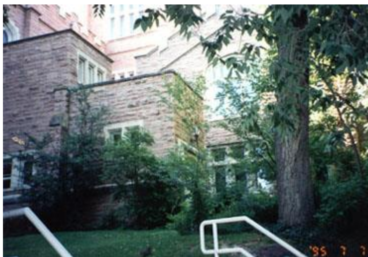
Концертный зал университета штата Колорадо