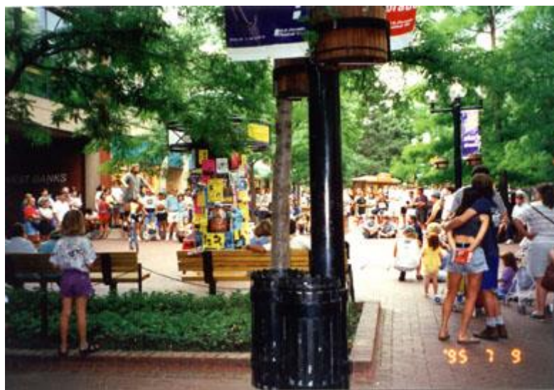
На Пёрл Стрит в Даун Тауне Боулдера