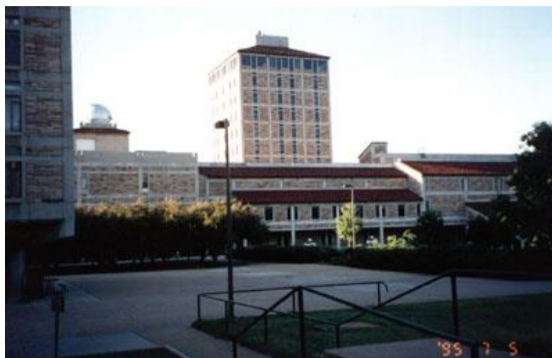
Джордж Гамов Тауэр. Корпус космических исследований

Днём искал магазин фототоваров, прошёлся большим крюком по Боулдеру по жаре (днём за 30 градусов, но хорошо переносится, воздух сухой). Магазин нашёл, возвращаясь, недалеко от Университета, но, как и большинство лавок, сегодня он закрыт в соблюдение Дня Независимости. Велосипедисты в шлемах кругом носятся, а мотоциклисты - без. На роликовых коньках по велосипедных дорожкам раскатывают в доспехах почти рыцарских.