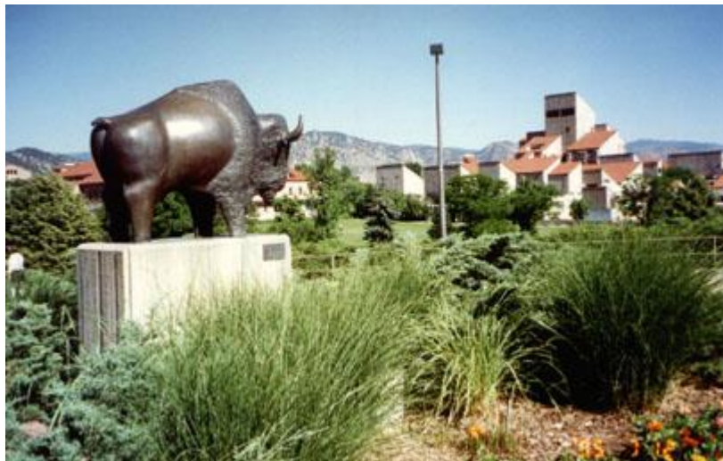
Бизон у Events Center (Arena) с видом на инженерный факультет университета штата Колорадо