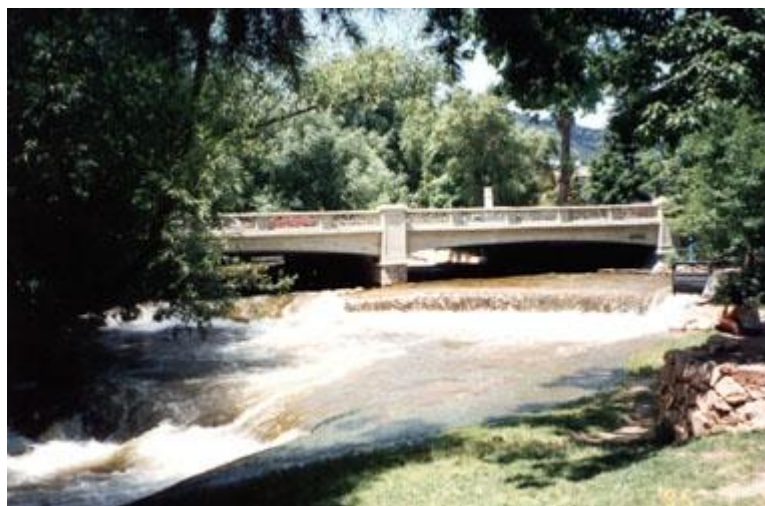
Boulder Creek - главная водная магистраль в Боулдере, вполне рыбная