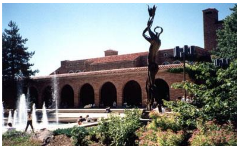
Фонтан у Мемориального Центра университета штата Колорадо