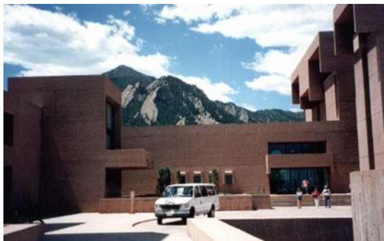
Здание NCAR (Национальный Центр Атмосферных Исследований США)