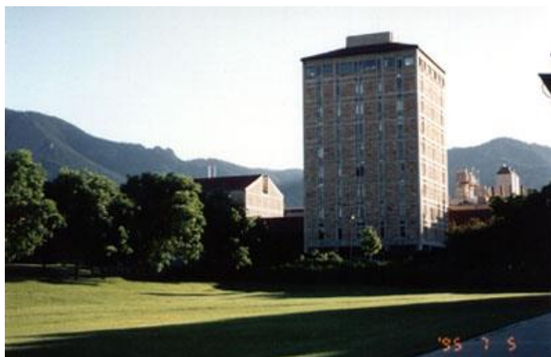
Джила Тауэр. Корпус физических лабораторий

наткнулся утром, возвращаясь с пробежки, тот удивился моему виду раздетому (майка, шорты) - утром прохладно было.