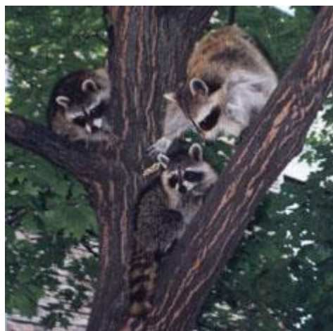
Опоссумы на улице в университетском кампусе