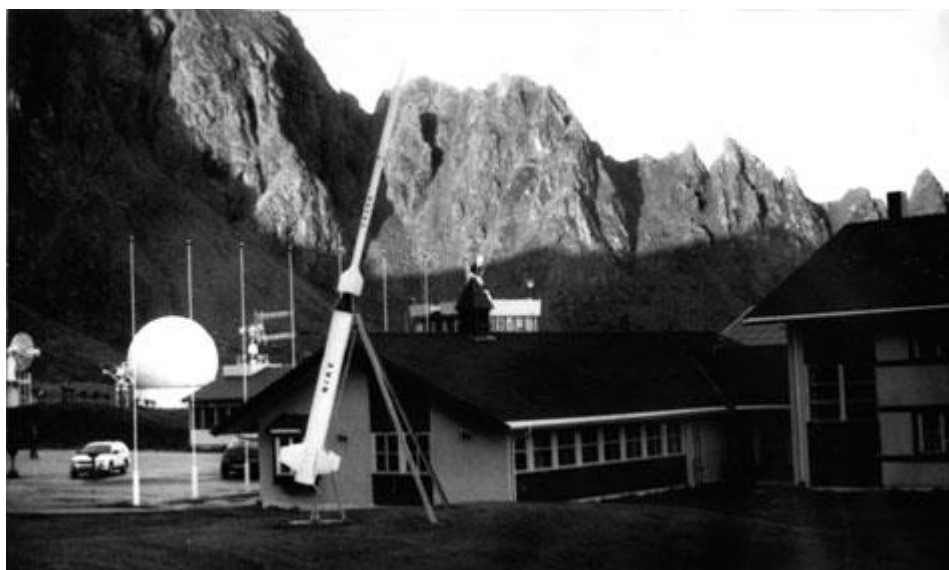
Анденес, космодром, 26 сентября 1993 г.

— В Анденесе нас, русских, поселили не в основной гостинице "Андрикек", где жило большинство участников воркшопа, а в 5 километрах от неё, на ракетном полигоне Andoya Rocket Range (ARR), прямо на берегу Норвежского моря. Окно моего номера выходило на противоположную от моря сторону, и вид из него представлял собой двухступенчатую геофизическую ракету Nike, установленную в качестве монумента, на фоне отвесного склона горы, подступившей к морю.