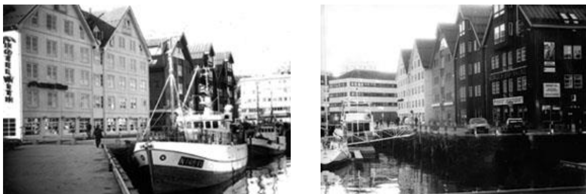
Наш отель на набережной (вид с двух сторон)

кроме того - кофе с горячими вафлями в любое время.