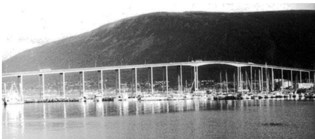
Тромсе, мост через пролив, 24 сентября 1993 г.

Поселили нас поодиночке, мне почему-то достался двухместный, точнее, с двуспальной кроватью номер. Телевизор - 15 программ, телефоны на столе, у кровати и около унитаза в туалете, туда же выведены динамики от телевизора. Всё опять же сверкает и полно удобств, например, костюмные брюки просто закладываешь в гладильное устройство и там хранишь, а потом надеваешь их отутюженными. Бар-