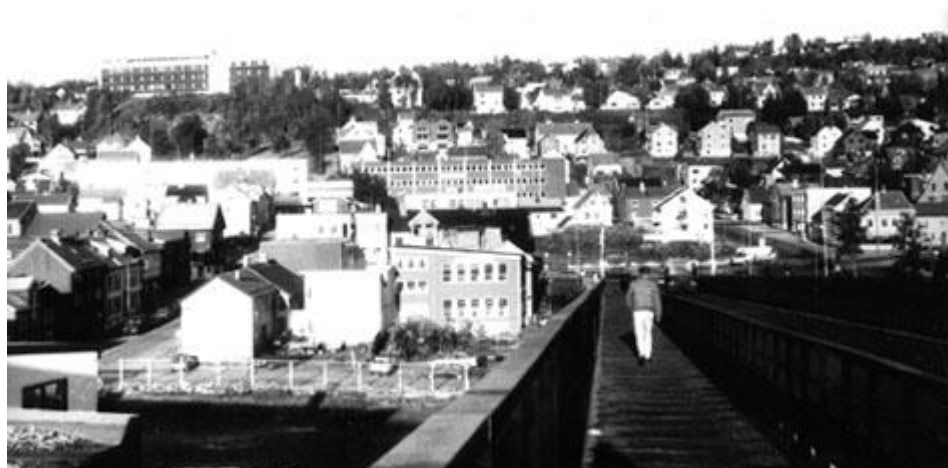
Виды на Тромсе с моста через пролив, 24 сентября 1993 г.

Затем вернулись на остров и пошли вверх, в гору, любуясь и удивляясь каждому дому, гаражу, изобилию цветов, газонам, фонарикам и т.д., и т.п., пока не добрались до Авроральной обсерватории, что в Университетском городке на самой макушке острова, оттуда вниз мимо кладбища в центр и вдоль витрин магазинов, в которых есть всё, к отелю.