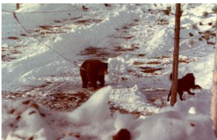
Натаскивание собак на медведицу, Лопарская, 12 марта 1992 г.

С этого зрелища гостей повезли к подножью горнолыжной трассы и предложили подняться пешочком по её склону, по специально вырубленным в снегу ступенькам. Поднявшиеся, мол, приз получают, да и вид сверху красивый. Народ послушно полез. Вид, действительно, красивый.