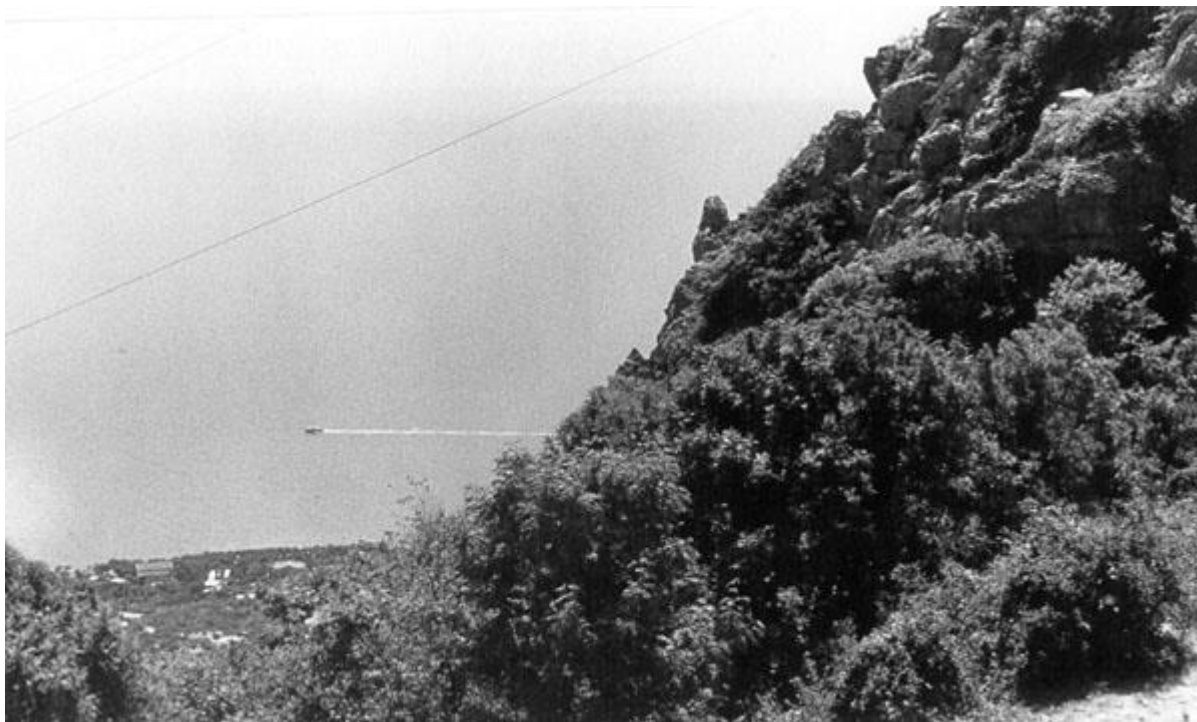
Вид от Байдарских ворот

Уже в потёмках меня подобрала какая-то "Волга", на которой я доехал до поворота на Трудолюбовку с шоссе Севастополь - Симферополь (у Новопавловки). Водитель "Волги" вытребовал с меня два рубля - всё, что у меня было, и это были все дорожные расходы за день. Оставшиеся километров пять до Трудолюбовки я прошёл пешком, явившись на базу уже за полночь первым из нашей компании, а вскоре прибыли и остальные, им всё же удалось на чём-то добраться всем вместе.