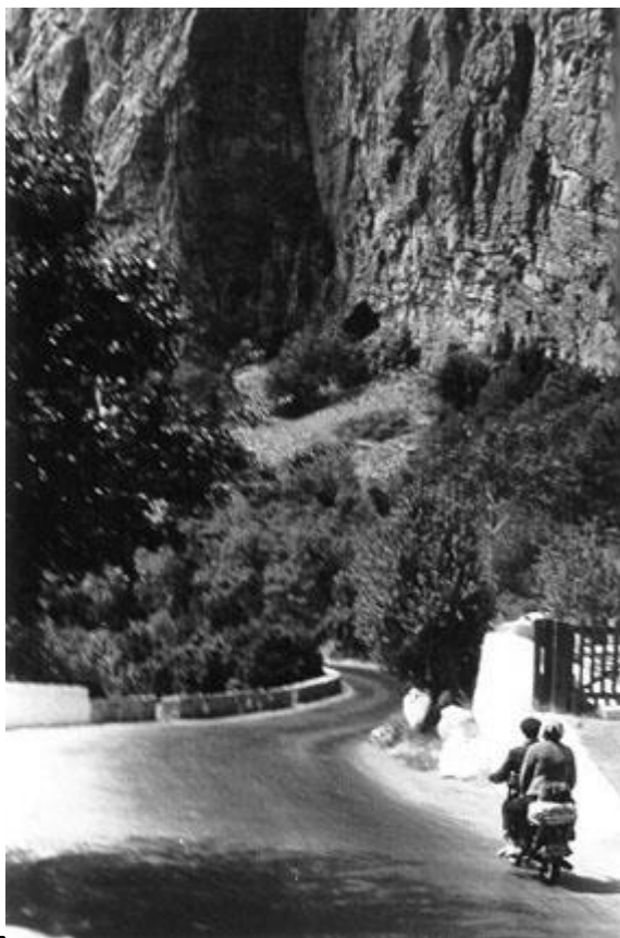
По южному берегу Крыма