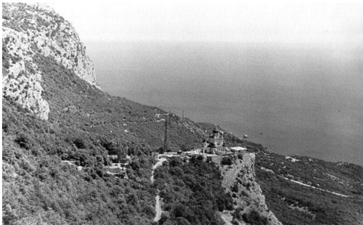
Вид от Байдарских ворот