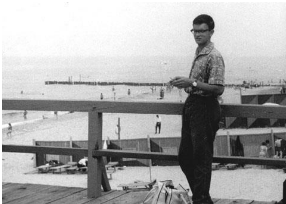
Медовая неделя в Калининграде

— Эти дни нам ничто не омрачало, погода была отличная, ездили на море в Светлогорск. Калининград понравился Сашеньке своей зеленью, но что он станет городом, где родятся и вырастут наши дети, не могло и в головы нам придти.