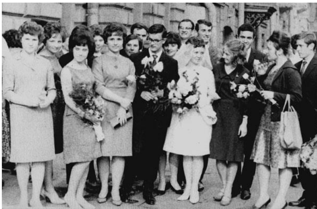
У входа во Дворец бракосочетания