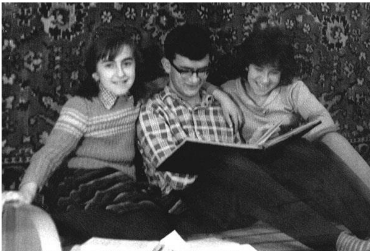
На каникулах в Калининграде, февраль 1964 г.