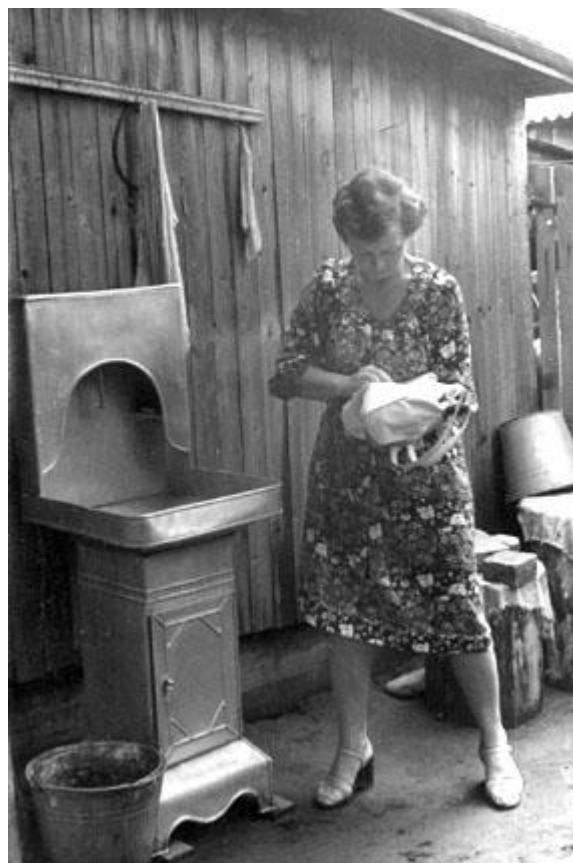
Перед выходом "в город"