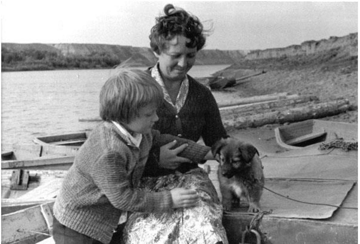
На Бие в день рождения Мити, Бийск, 26 июля 1981 г.

— Но меня больше всего волнуют возможности рыбалки, к которой я загодя максимально подготовился: приобрёл новое пластиковое телескопическое, шестиколённое удилище, которое в сложенном виде помещалось в чемодан, снарядил его пропускными кольцами, катушкой и, главное, конической плетёной лесой, предназначенной специально