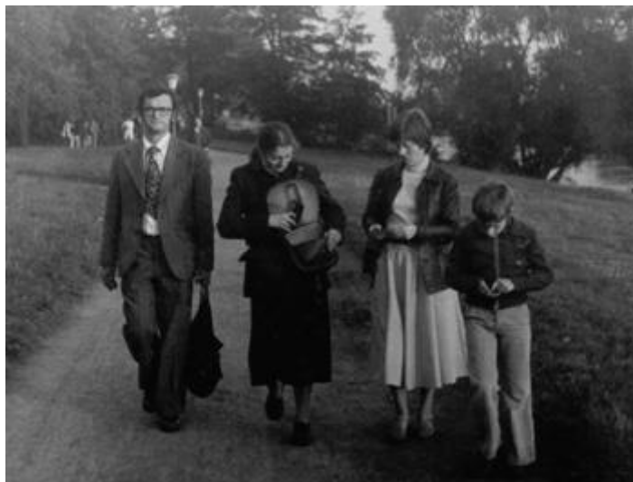
В парке Пильниц на Эльбе

Минут сорок ехали на трамвае. Переправа через Эльбу. Быстрая мутная река. Парк и дворец-музей Пильниц. Впечатления, совершенно аналогичные полученным от Сан-Суси. Наши дамы потрясают нас добросовестным разглядыванием всех экспонатов: пришёл в музей - смотри. Мы же быстро очумели. Отошли немного в кафе парка, где всласть попили пива. Дамы пиво тоже пьют охотно. Вообще мы тут поняли, что пиво - это национальный немецкий напиток. В отель вернулись к 19.00. Сбегали на вокзал, купили "Альтен Заксен Марке" - коричневую жидкость крепостью 35°. Поужинали в номере. Сделали записи в своих дневниках, послушали "Маяк", рано легли спать. Ноги опять гудели. Заснули как убитые.