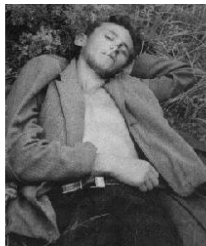
Послеобеденный отдых (намаялись)