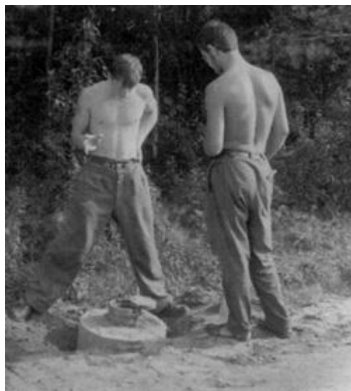
Я и Корабел