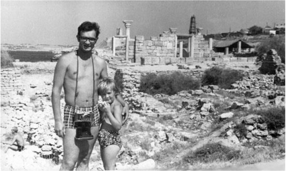
В Херсонесе, август 1971 г.